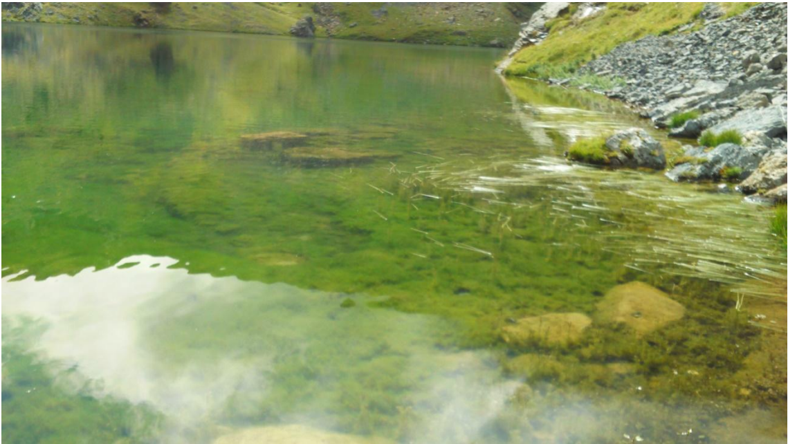
Detalle macrófitos ibón de Sabocos