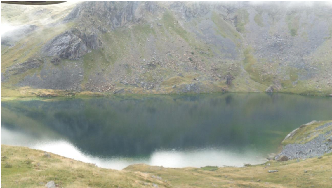
Vista general del ibón de Sabocos