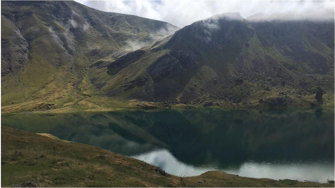
Detalle orilla del ibón