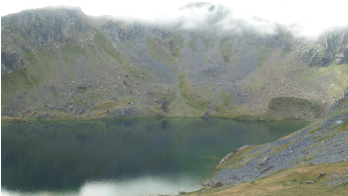
Vista general del ibón de Sabocos